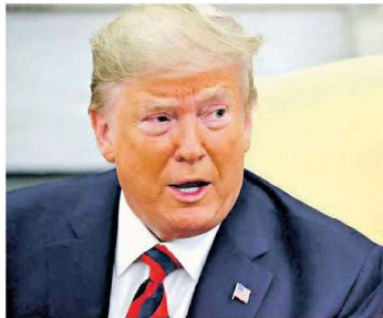
Trump reservou 80% de sua criptomoeda, que já valoriza 1.239%

A criptomoeda de Trump é classificada como meme-coin, quando o token é inspirado em piadas da internet, mas acaba se transformando em ativo financeiro, uma vez que as negociações em série valorizam seu preço. O visual da meme-coin de Trump é uma foto em que o republicano aparece com o pulso erguido com a palavra "fight" (lute, em por-