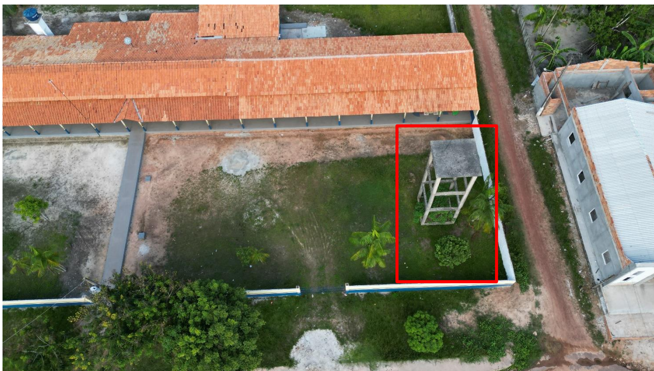
Foto 2 – Terreno a ser implantado o Sistema de abastecimento de Água da Vila do Broca.

Após definição das unidades foi definido a localização do SAA Broca que ficará nas coordenadas LAT: 1°42'27.21"S e LONG: 46°48'33.26"O em terreno de 10m x 10m na Cota 52m, conforme foto a seguir: