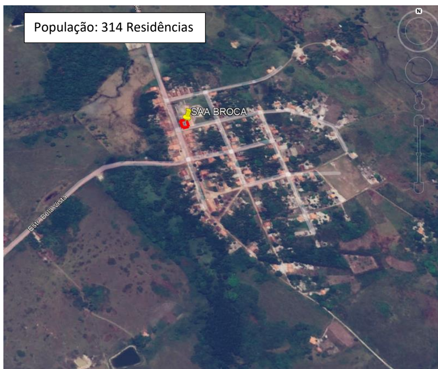
Foto 1- Localização da área de atuação do Projeto SAA Broca.

O local de implantação será na VILA DO BROCA de coordenada geográfica LAT: 1°42'27.21"S e LONG: 46°48'33.26"O, conforme Foto 1