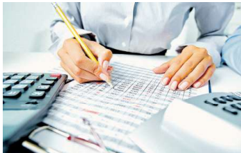
Contribuinte deve reunir documentos e cumprir o prazo de entrega